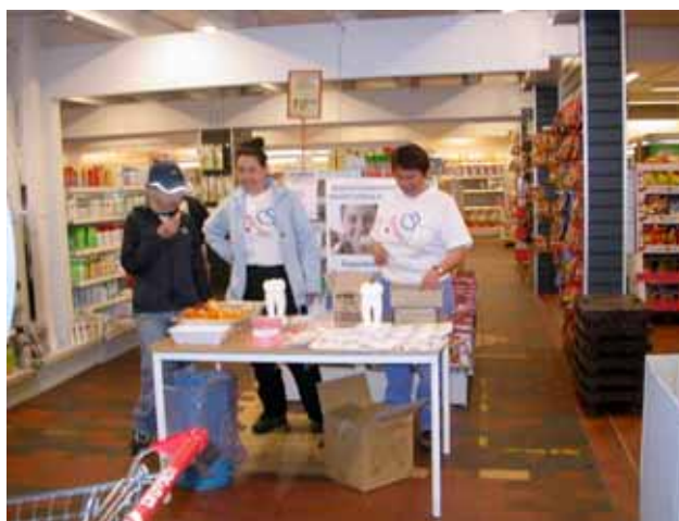
Tandbod i Pisiffik