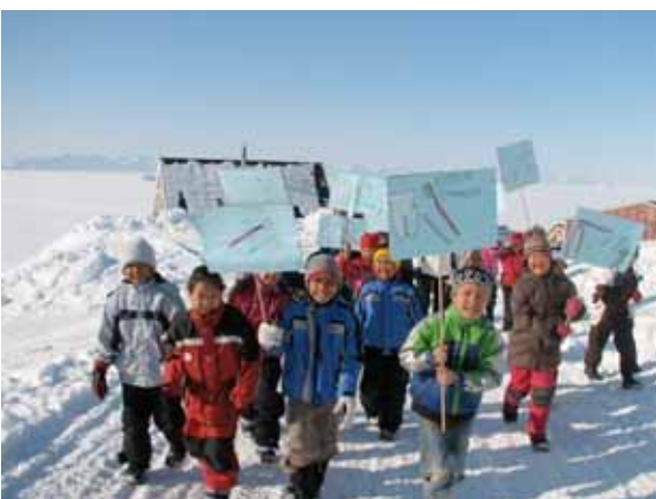
March gennem Ittoqqortoormiit

For afgangsklasserne blev der serveret vand, tørfisk, frosne bær og æbler. Der blev vist DVD om de 10 kostråd, uddelt el-tandbørster og givet undervisning i tandbørstning.