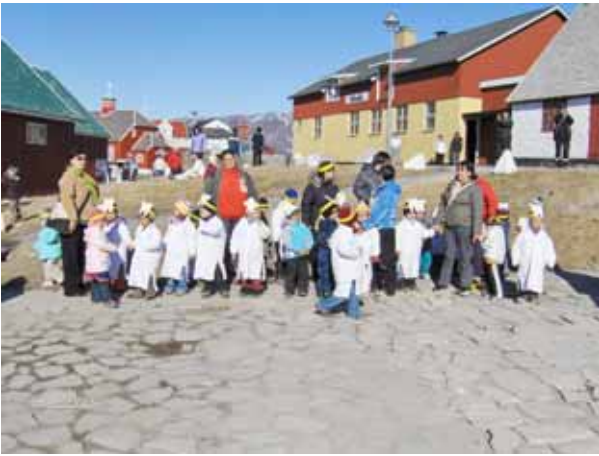
Så gøres der klar til optog med sang