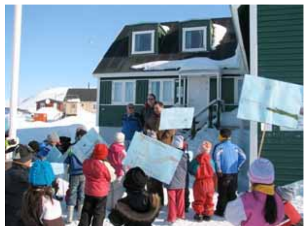
Borgmesteren holder tale