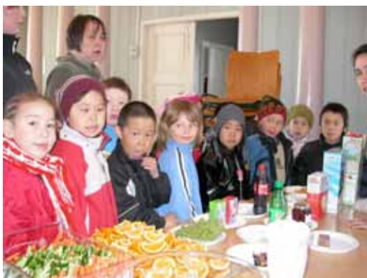
Indimellem var der undervisning i sund og usund kost