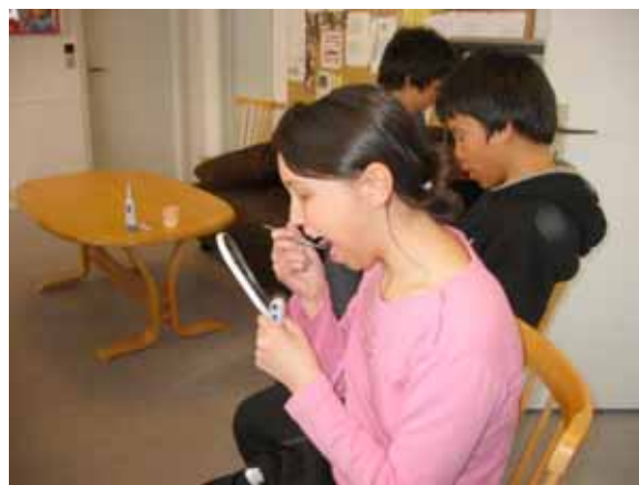
Tid til selvundersøgelse...