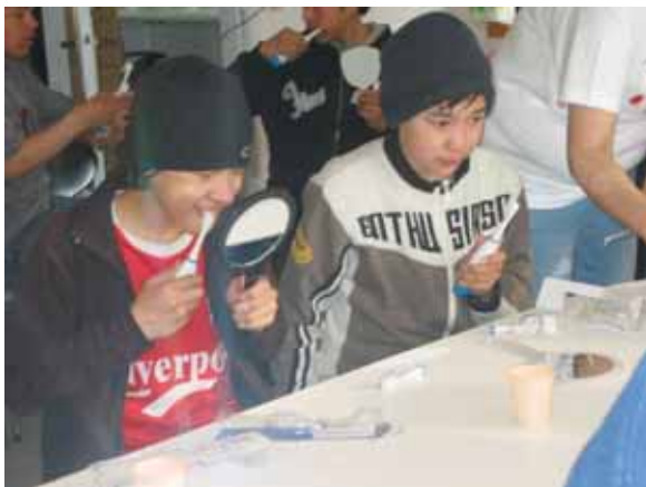
Den elektriske tandbørste blev brugt flittigt