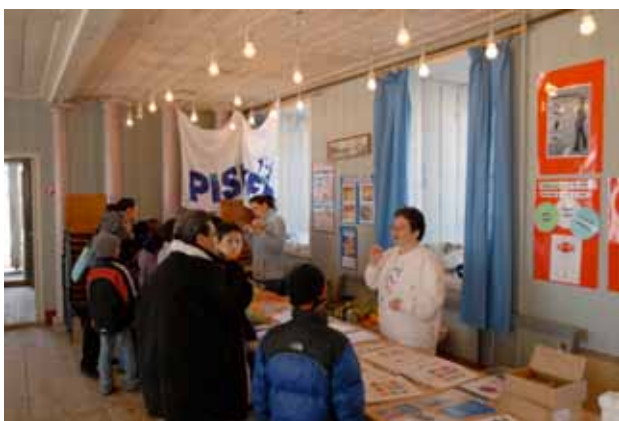
Så er der undervisning...

Her er billeder fra dagen i Den gamle Kirke :