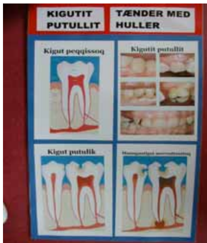
Der hænger flotte plakater