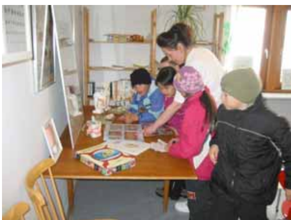
...og undervisning af de små

I Aasiaat lavede elever fra 9.klasse plakater, som blev hængt op i børnehaver, vuggestuer og skolen. Disse plakater viste blandt andet, hvordan den daglige mundhygiejne vedligeholdes.