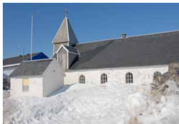
... i Den gamle Kirke !