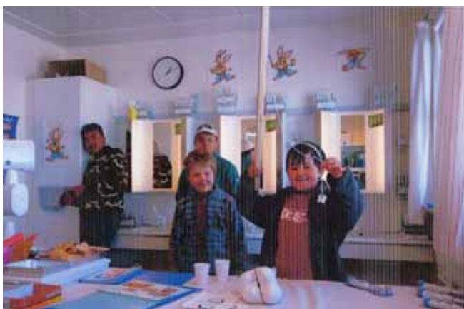
Så er der fiskedam...

Dagene op til tandbørstedagen var der Piteraqaq (orkan), og det gjorde det umuligt at hænge plakater op i byen. Derfor blev det først annonceret ordentligt eftermiddagen før selve tandbørstedagen, og alligevel blev det en meget vellykket dag med masser af besøgende, børn, unge og voksne.