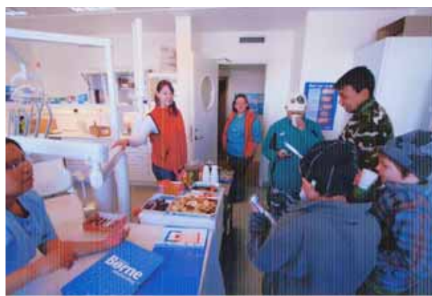
...og åbent hus for alle

Tandbørstedagen i Nanortalik markeredes med, at alle skolebørn fra 1. klasse til 9. klasse fik grundig undervisning i at børste tænder, og hver elev fik en tube tandpasta med hjem.