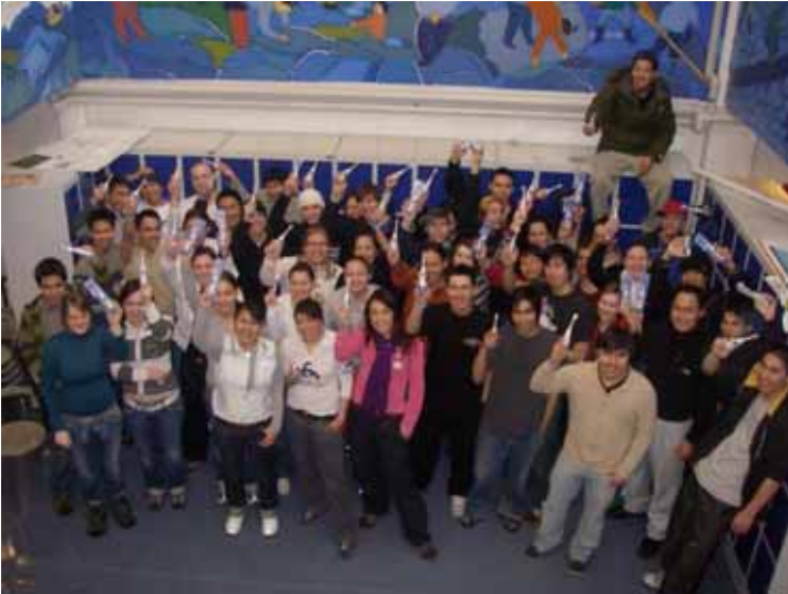
Glade HTX elever med el-tandbørster

Udover disse fik både HTX - elever, Knud Rasmussen Højskolen, Anstalten for domfældte, Qasapi ( værested for unge med adfærdsvanskeligheder ) en elektrisk tandbørste.