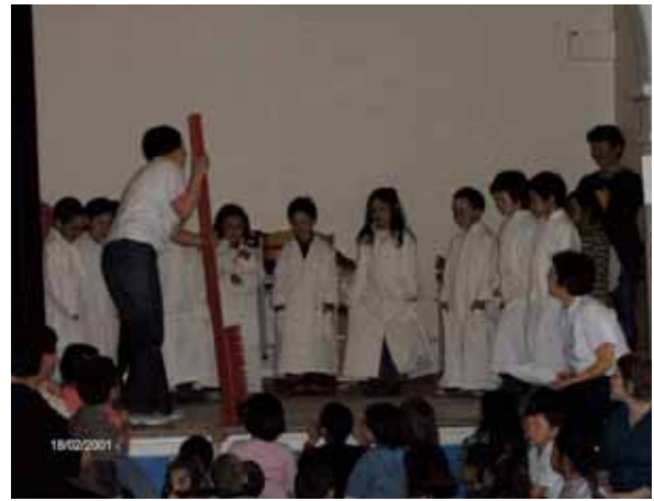
Teaterforestilling " Kigutivut salitsigit"